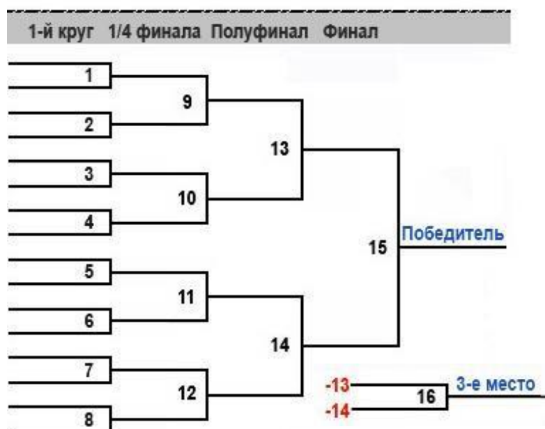
Табл.1 – сетка для 16 участников

Участники полуфинального тура, не прошедшие в финал, проходят дополнительный тур для определения 3 места. (Если в ходе соревнований в финальный тур выходят 3 участника, то все призовые места распределяются в ходе финального тура).